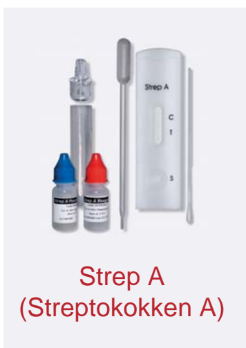
Strep A (Streptokokken A)